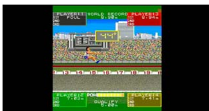
『ゴールドメダリスト』