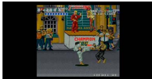
『ストリートスマート』