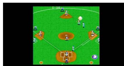
『SUPER CHAMPION BASEBALL』