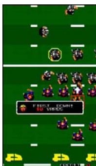
『タッチダウンフィーバー』