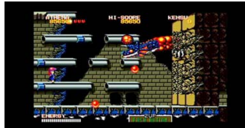
『サイコソルジャー』