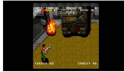
『IKARI III -THE RESCUE-』