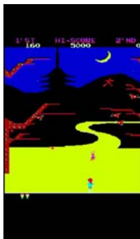
『サスケ VS コマンダ』