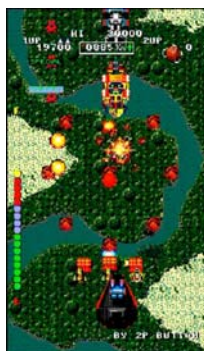
『バムューダトライアングル』