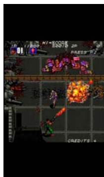
『SAR サーチ アンド レスキュー』